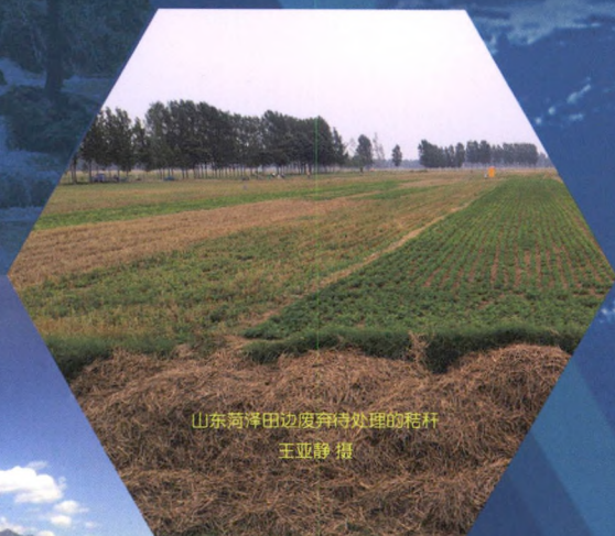
山东菏泽田边废弃待处理的秸秆