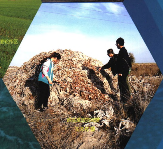
夏季玉米-冬小麦轮作区