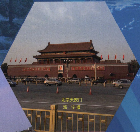
北京天安门