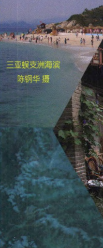
三亚蜈支洲海滨