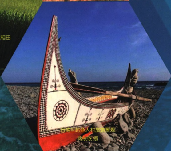
台湾兰屿渔人村旅游景观