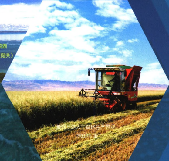
黄河上游人工草地生产景观