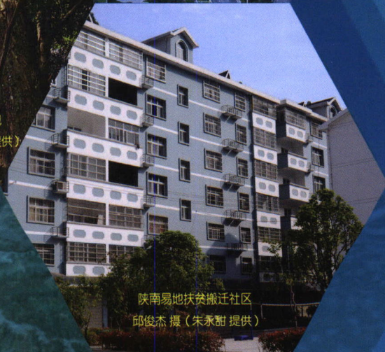
陕南易地扶贫搬迁社区