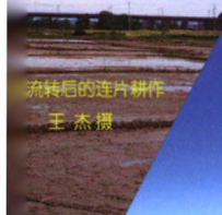
流转后的连片耕作