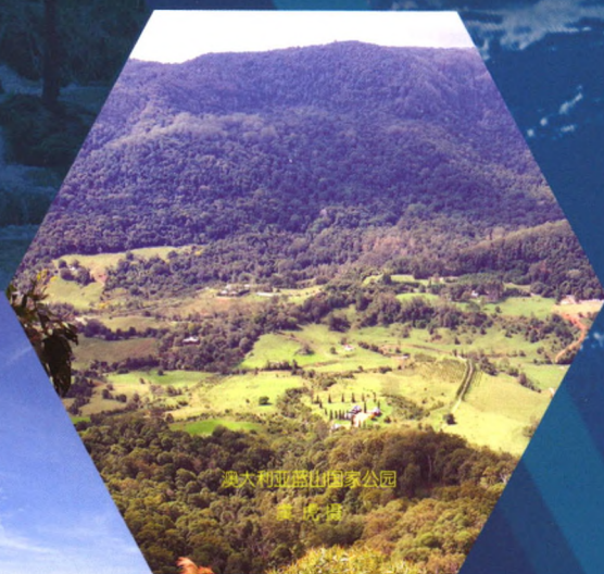
澳大利亚蓝山国家公园