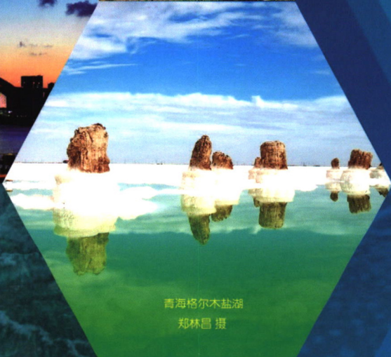
青海格尔木盐湖