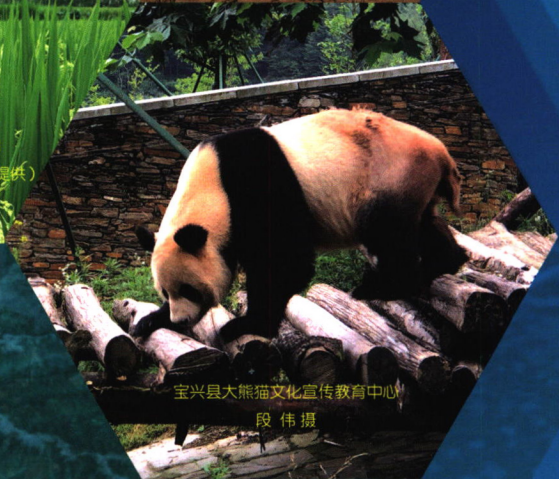
宝兴县大熊猫文化宣传教育中心 段伟摄