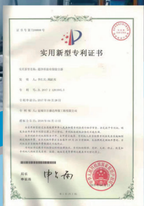
铸造成型机生产线布袋除尘器