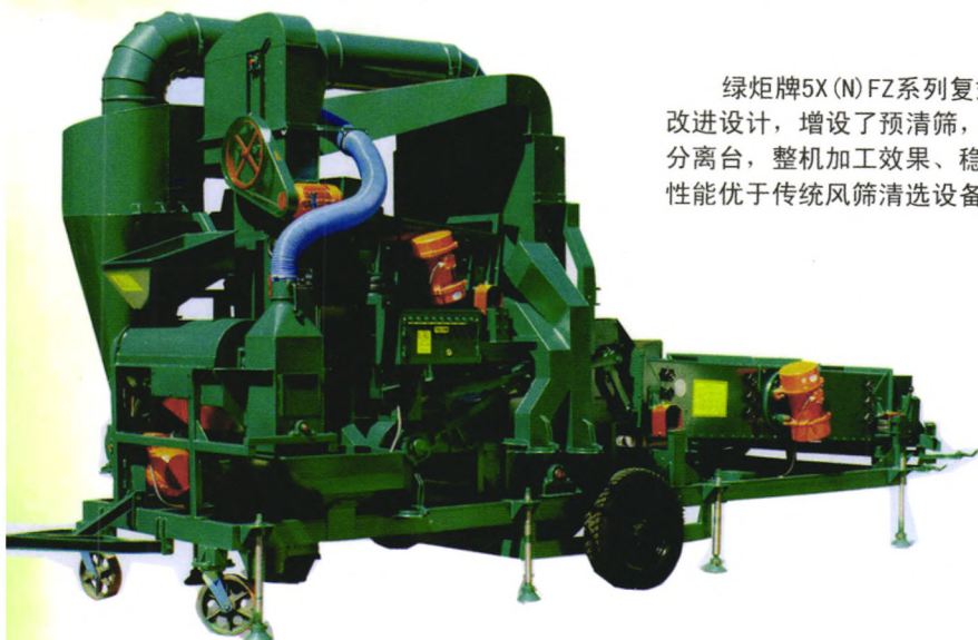
5XNFZ-10A型种子复式精选机

绿炬牌5X(N)FZ系列复式精选机，在前代机型的基础上进行了大幅度的改进设计，增设了预清筛，配合上加宽的立式空气筛和优化设计的准比重分离台，整机加工效果、稳定性、易操作性、环保性能明显提高，是一款性能优于传统风筛清选设备的新机型。