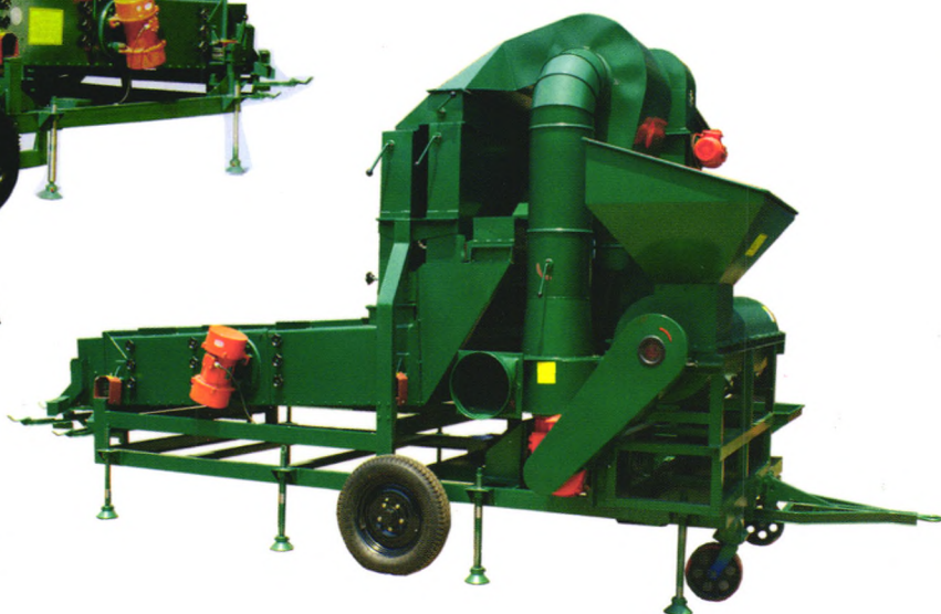
5XCFC-10型草籽脱芒筛分车

绿炬牌5X(N)FZ系列复式精选机，在前代机型的基础上进行了大幅度的改进设计，增设了预清筛，配合上加宽的立式空气筛和优化设计的准比重分离台，整机加工效果、稳定性、易操作性、环保性能明显提高，是一款性能优于传统风筛清选设备的新机型。