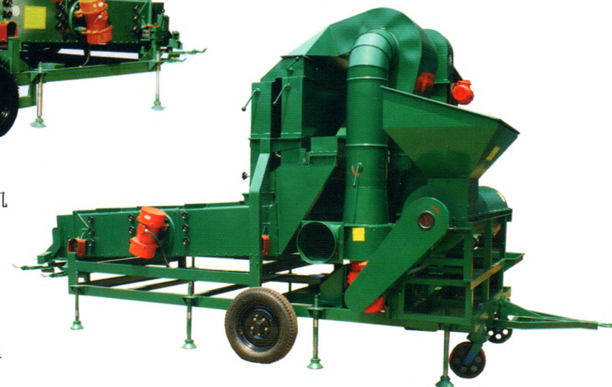
5XCFC-10型草籽脱芒筛分车